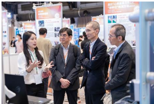
成果展示區團隊作品