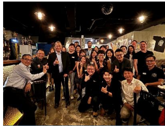
國際賽團隊交流茶會