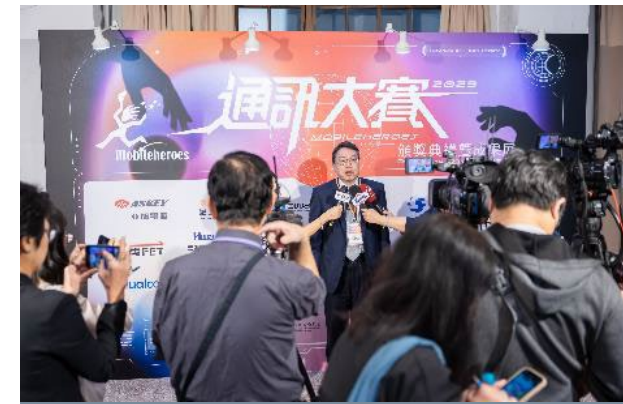
電子媒體 / 平面新聞 / 電視新聞